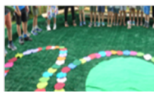
Gottesdienst mit Legearbeit